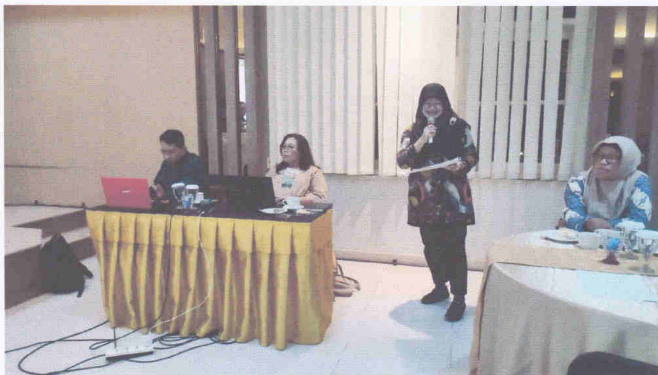
Rapat Pembahasan Penguatan PPID Melalui Peningkatan Kapasitas SDM dan Penyusunan Regulasi sebagai Petunjuk Informasi Tahun 2024