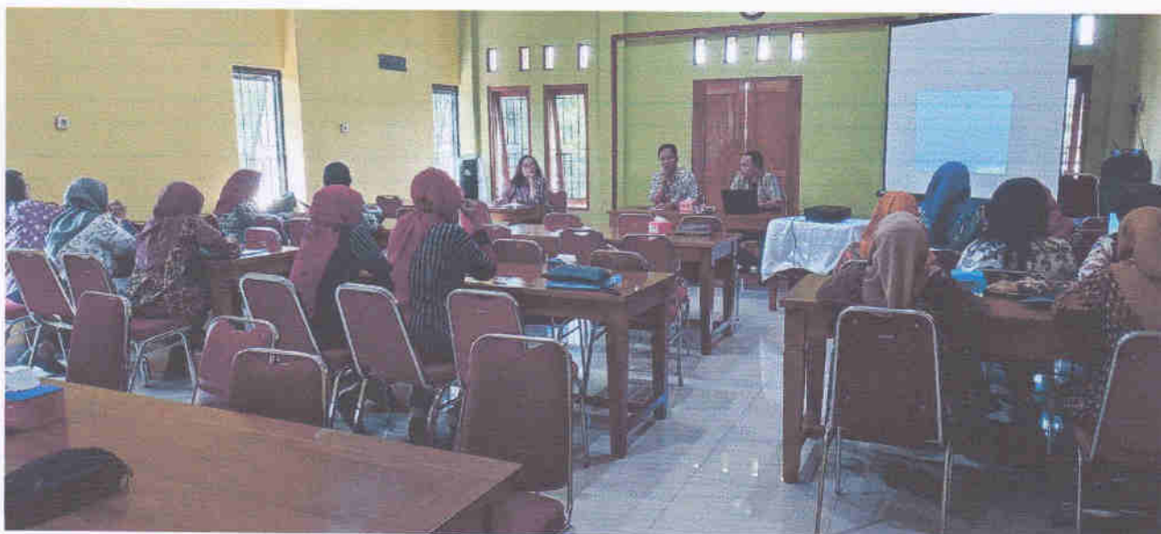
Rapat Pembahasan Rencana Daftar Informasi Publik dan Usulan Informasi yang Dikecualikan Tahun 2024